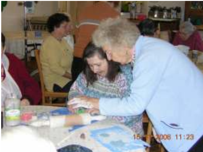
Es wurde wieder eifrig getöpft.