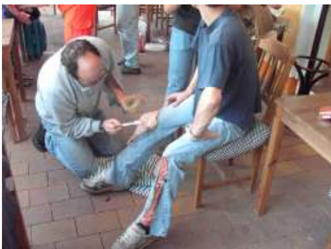
Die Verletzungen bei der Übung waren natürlich nur geschminkt.