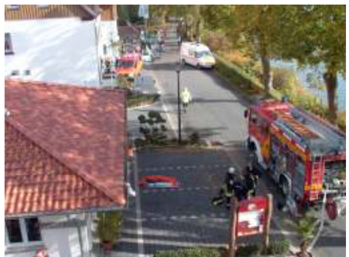
Großes Aufgebot an Feuerwehrfahrzeugen.