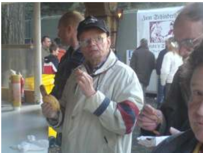
Die traditionelle Bratwurst auf der Kirmes.