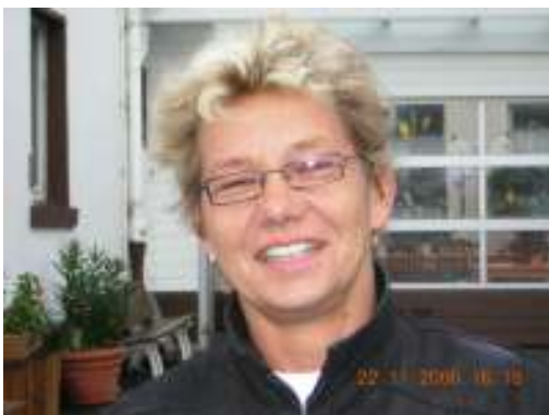
Ausführende Architektin: Dipl.-Ing. Bettina A.