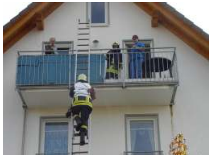
Hoch hinaus bei der Feuerwehrrübung.